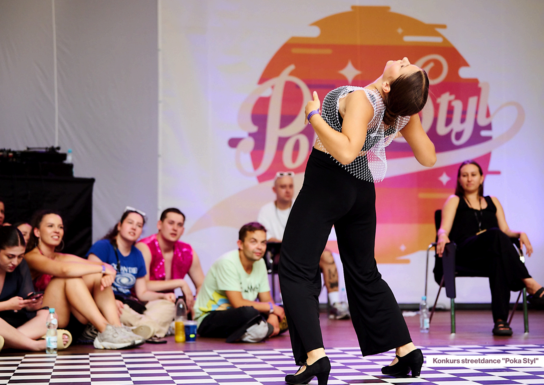
Konkurs streetdance "Poka Styl"